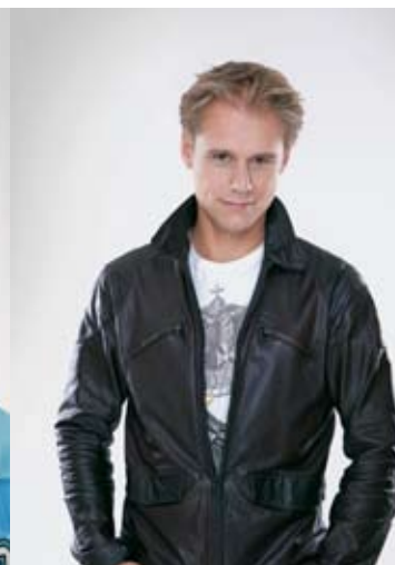
Armin van Buuren